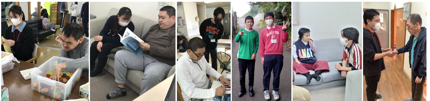
[10月~12月に受け入れた教育実習生さんです]

3日(火) 嘱託医往診 / 支援会議(通所・GH) / 4日(水) ランチ🍷 選択メニュー(しゅうまい or はむかつ) / ジムの日 ふれあい会(入所者自治会) / 5日(木) エアロビ / 6日(金) 食生活委員会 / 9日(月) 遊美術[写真次号] / 消防設備点検(学園) / 10日(火) 七沢森林公園清掃🧹 ランティア / 安全点検の日・リスク人権委員会 11日(水) ランチ🍷 お楽しみメニュー(みくくすふらい🍷) / 訪問理美容 / 音楽 / 12日(木) 総合防災訓練 / 移動販売 14日(土) 農福連携収穫祭[記事] / 16日(月) 教育実習生受入れ(~20日(金))[写真] / 17日(火) 書道教室[写真次号] 18日(水) ランチ🍷 選択メニュー(たんどりーちきん or ひれかつ) / ジムの日 / マイクロバス点検 / 19日(木) エアロビ 21日(土) クリスマス会(入所利用者さん・ご家族)[記事] / 🙄花火大会🙄 / 24日(火) 七沢森林公園清掃🧹 ランティア 25日(水) ランチ🍷 クリスマスメニュー / ジムの日 / 26日(木) 支援会議(入所) / 園内研修(テーマ:視覚障害者支援)[記事] 27日(金) 納め会 / 仕事納め / 28日(土)~1月5日(日) 年末年始休日期間