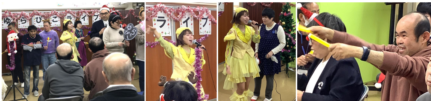
[担当:橋本恵子,伊藤恵美,小代弘子,北田佳奈子]

そして…。30分ほどのミニライブの予定が全12曲熱唱の1時間フルライブに！最後は、ゆらぴこさん、利用者さん、ご家族、職員、皆で「赤鼻のトナカイ」を熱唱しての閉会となりました。アイドル推しグッズを手にとり、振りまくって応援する利用者さんの姿がとても印象的！ゆらぴこさんのおかげで、利用者さんたちの別の一面を垣間見たスタッフ一同でした。